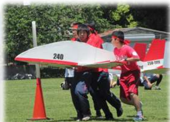
ふようインパルスの華麗な音速飛行