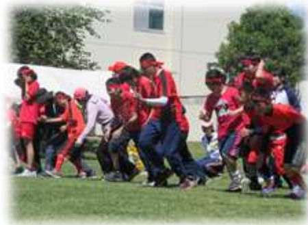
1本でも多く取るぞ！中高合同種目