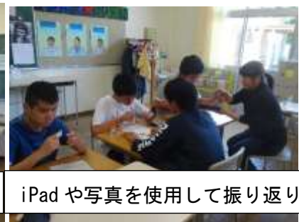
iPad や写真を使用して振り返り