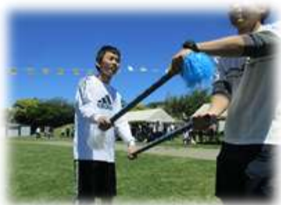
息の合ったダンス中高合同パフォーマンス