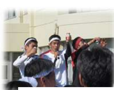
閉会式より お疲れ様の乾杯

単元中は、児童生徒会、応援団、係活動、委員会活動などで準備活動をよくがんばりました。当日は、晴天にも恵まれ、一人一人が仲間と力を合わせて精一杯の力を発揮することができました。保護者の皆様には、温かいご声援やご協力をいただき、本当にありがとうございました。