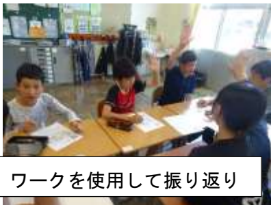
ワークを使用して振り返り

*大運動会ではたくさんのご声援をいただきありがとうございました。今年も一人一人目標を決めて運動会に臨みました。それぞれがきちんと振り返りをし、次につなげることのできる单元だったと思います。单元全体を通しての感想ですが、毎日の取組の中で、より頑張ろうとする子どもたちの気持ちや行動の変化がよく伝わり、与えられた役割に真面目に取り組む姿に触れることができ嬉しく思いました。