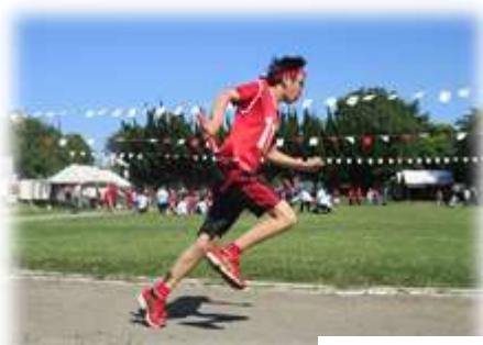
全力で駆け抜けた紅白リレー