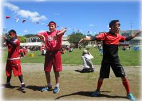
みんなの先頭に立ってがんばった応援