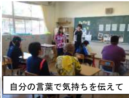
自分の言葉で気持ちを伝えて